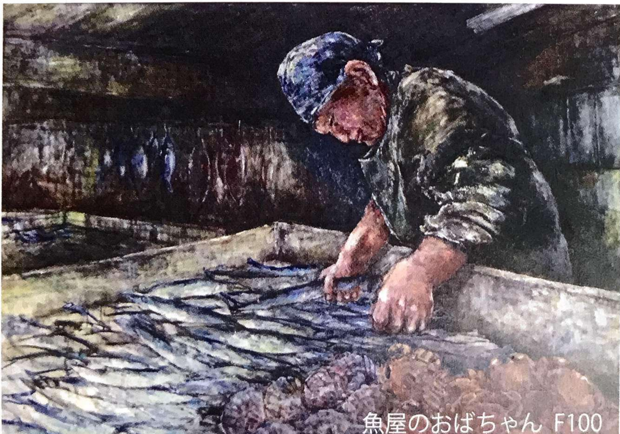
魚屋のおばちゃん F100